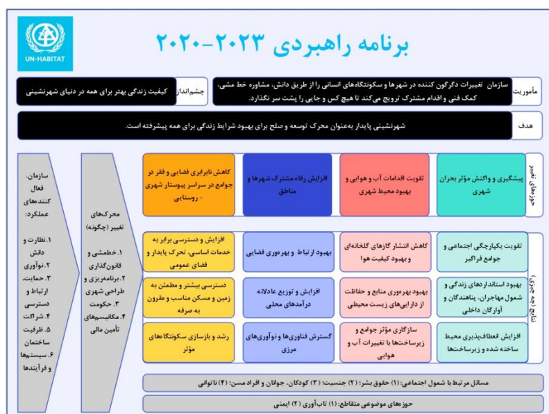
شکل ۱. برنامه راهبردی ۲۰۲۰-۲۰۲۳ برنامه اسکان بشر سازمان ملل

پارادایم در روشی است که سازمان کار می‌کند و می‌تواند به ایجاد تغییرات دگرگون کننده در شهرها و سکونتگاه‌های انسانی کمک کند. شکل ۱، برنامه راهبردی ۲۰۲۰-۲۰۲۳ سازمان را نمایش می‌دهد.